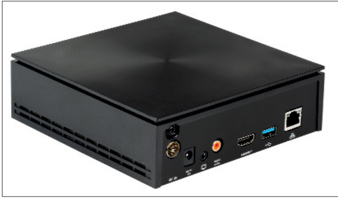
Set-Top-Box für purTV

seinen mobilen Endgeräten und der Set-Top-Box während einer Sendung ganz leicht wechseln. Mobile Endgeräte werden zur Fernbedienung des Großbildschirms. Die Kombination aus der IPTV-Plattform, der IP-basierten Set-Top-Box, zusammen mit den Multiscreen-Endgeräten, führt zu einer integrierten Lösung. Eine einzige Bedieneroberfläche, über die Set-Top-Box generiert, einzusetzen, empfinden Nutzer nachweislich als komfortabel – und schätzen den Mehrwert.